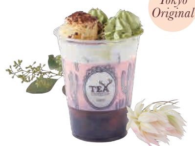
ほうじ茶ドリーム Roasted Green Hojicha and Matcha Dream

甘く香ばしいほうじ茶ミルクと、ほろ苦い抹茶エスプーマのテイスティ・ジャパニーズ・ドリンク。