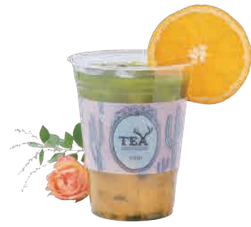
抹茶サンライズ Matcha Sunrise