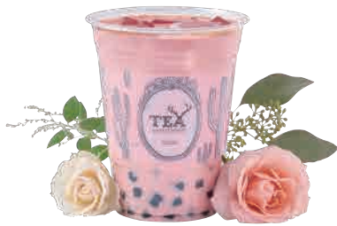
アルフレッド ピンクドリンク Alfred Pink Drink