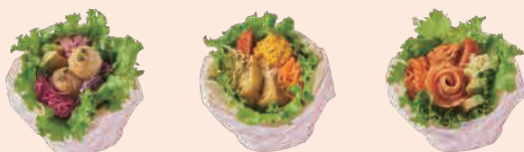
ファラフェルピタサンド 580 Falafel Pita Sandwich

ノンフライのファラフェル(ひよこ豆のコロッケ) / ピーズのフムス / 紫の野菜のマリネ