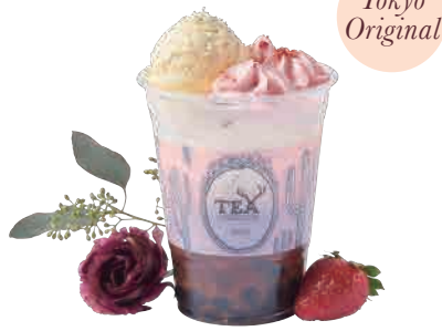
ストロベリードリーム Strawberry Dream

甘いストロベリーの香りに癒されるミルクティー。バニリアイスと莓エスプーマを添えて。