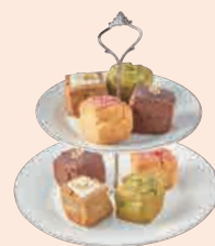
ビーガン スコーン 280 紅茶 / 抹茶 / ストロベリー / チョコレート Tea / Matcha / Strawberry / Chocolate