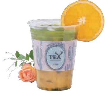
抹茶サンライズ Matcha Sunrise