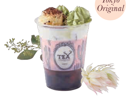
ほうじ茶ドリーム Roasted Green Hojicha and Matcha Dream

甘く香ばしいほうじ茶ミルクと、ほろ苦い抹茶エスプーマのテイスティ・ジャパニーズ・ドリンク。