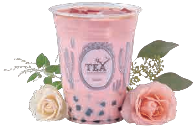
アルフレッド ピンクドリンク Alfred Pink Drink