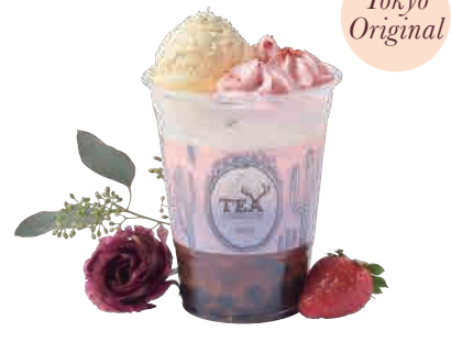
ストロベリードリーム Strawberry Dream

甘いストロベリーの香りに癒されるミルクティー。バニリアイスと莓エスプーマを添えて。