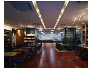
第 12 回「TOKYO PEOPLE'S CAFE(駒沢大学)」