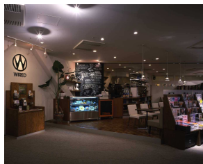
第 12 回「WIRED CAFE 渋谷 QFRONT 店」