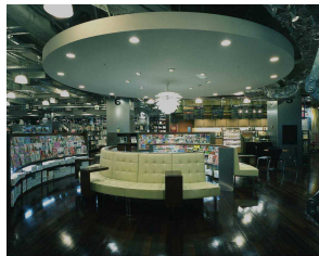
第 12 回「TSUTAYA TOKYO ROPPONGI (六本木)」