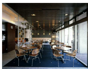
第 13 回「246 CAFE<BOOK(青山一丁目)」