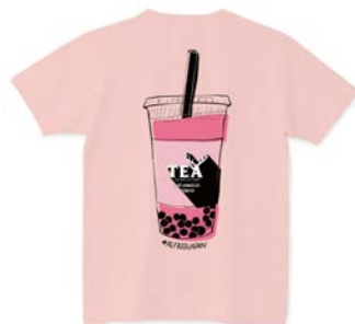
「原宿店」オープン記念Tシャツ